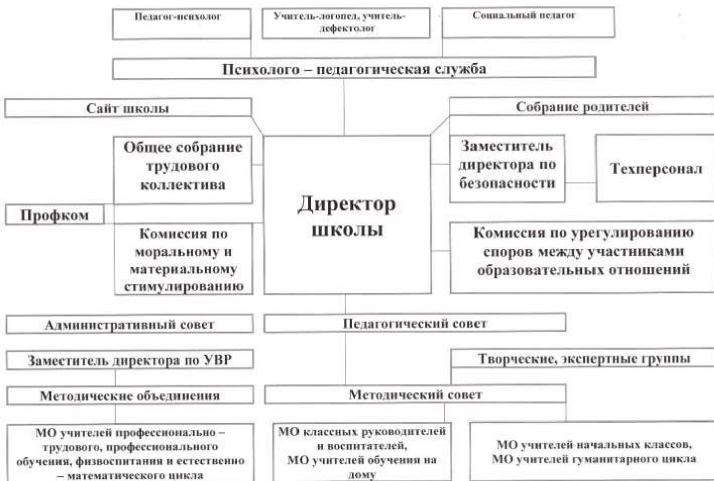
4.3 Система педагогического менеджмента (система управления)